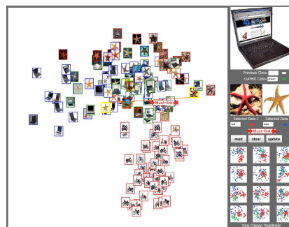
図 3: HAL を促すシステムデザイン